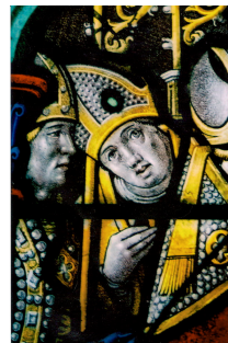
Verrière Ste Madeleine, XVIe siècle